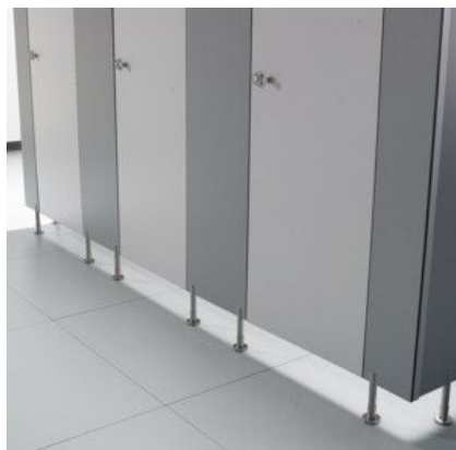
Fig.1 - Compartimentos / divisórias de WC.

O fenólico permite também ser utilizado em sinalética, trabalhando o material no seu interior.